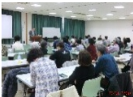
自然の大切さを真剣に学ぶ参加者

自然を守ってこそ、人々の心を豊かに育ましてくれるものである。自然は一度壊すと元には戻らない。それに多くの人が気づくことが大切である。」と力説されました。