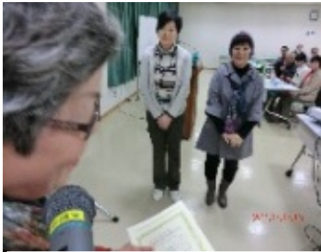
玉井代表から表彰状が授与されたお二人