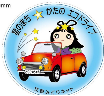
▲星のまち かのエコドライブ

エネルギー部会で検討していましたが、「エコドライブ」推奨のためのステッカー(案)が出来上がりました。