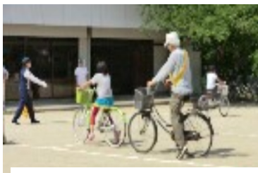
天野が原町での講習会事例

各部会で開催される講習会、行事などには自らが所属してない部会・PJでも積極的に参加して、良い経験は自らの部会にも活かしましょう。