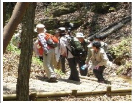
自然環境に親しむ参加者