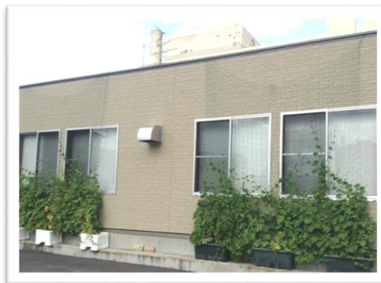
市役所別館の横(駐車場側)の「みどりのカーテン」