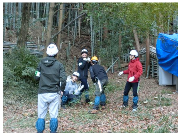
(奄山) 大學生も楽しく参加！