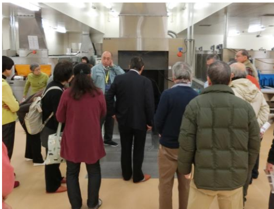
寺本給食センター所長からの説明