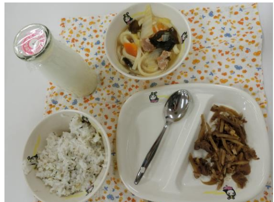
普段子ども達が食べている給食を試食